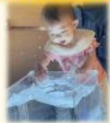
✓ 水に反射する光を楽しむ など