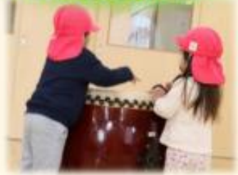
✓ 楽器を使い音の振動を感じる など

「あれ?」「なにかな?」という好奇心や 夢中になって遊び込む探究心を大切に育てていきます